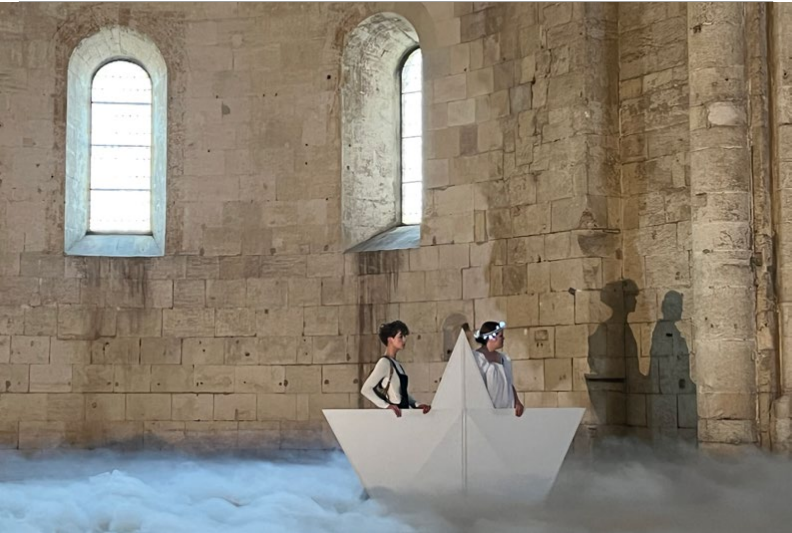
Abbaye de Montmajour - Décembre 2021