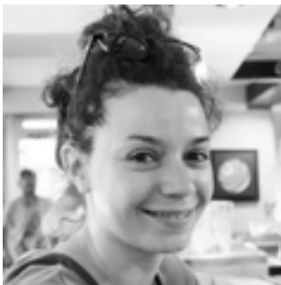
Lola Delelo Régie lumières Régie générale