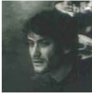
Guillaume Allory Régie son & vidéo